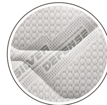
TESSUTO SILVER ANTIBATTERICO